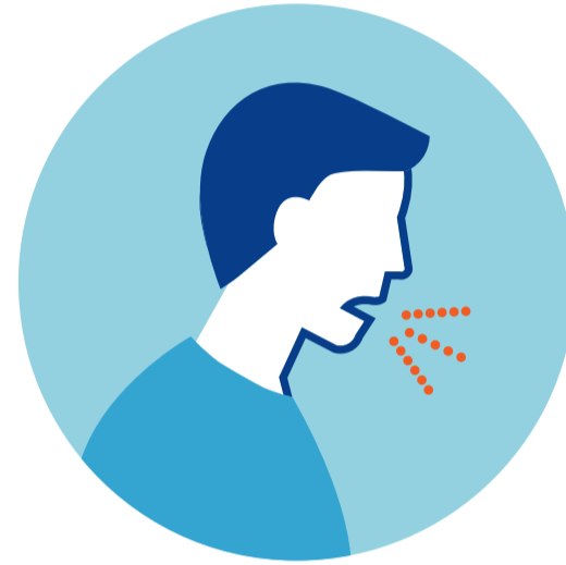
ВОЗДУШНО- КАПЕЛЬНЫЙ ПУТЬ

Через зараженные поверхности – рукопожатия, поручни в транспорте, дверные ручки, другие предметы и поверхности.