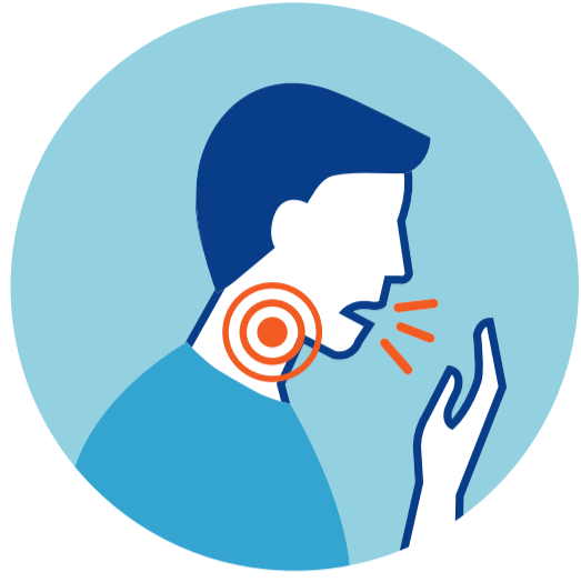
КАШЕЛЬ И/ИЛИ БОЛЬ В ГОРЛЕ