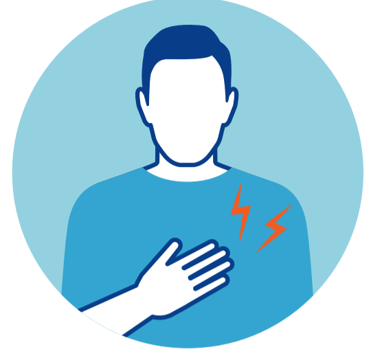
БОЛЬ В МЫШЦАХ