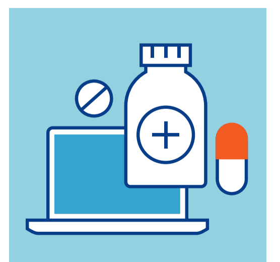
НЕ ЗАНИМАЙТЕСЬ САМОЛЕЧЕНИЕМ